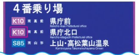
行先案内看板 (山形駅前④乗場)