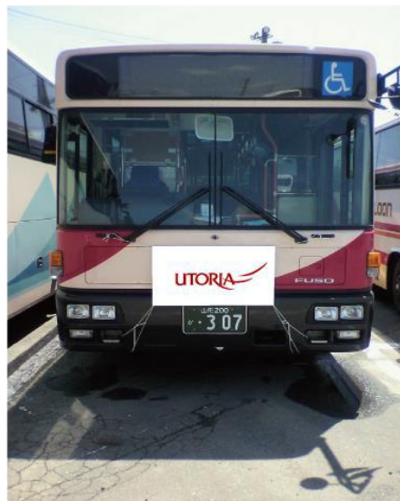
例：バスフロントマスク