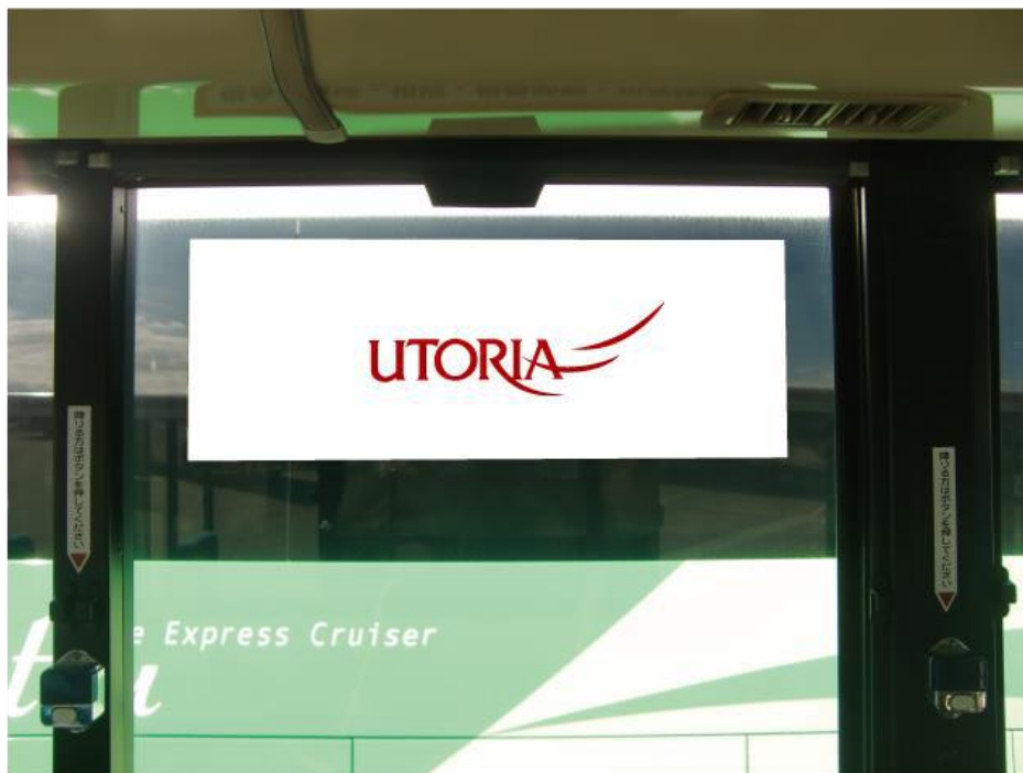
例：ウィンドステッカー