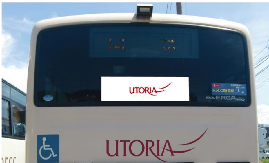
例：後部ステッカー