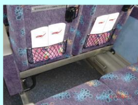
車内リーフレット