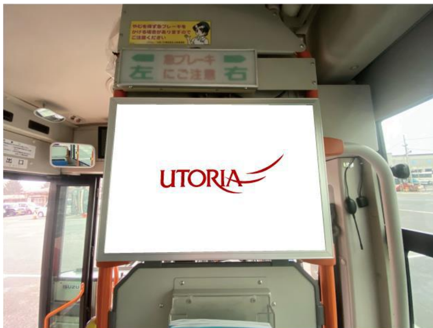
例：運転席後部ポスター