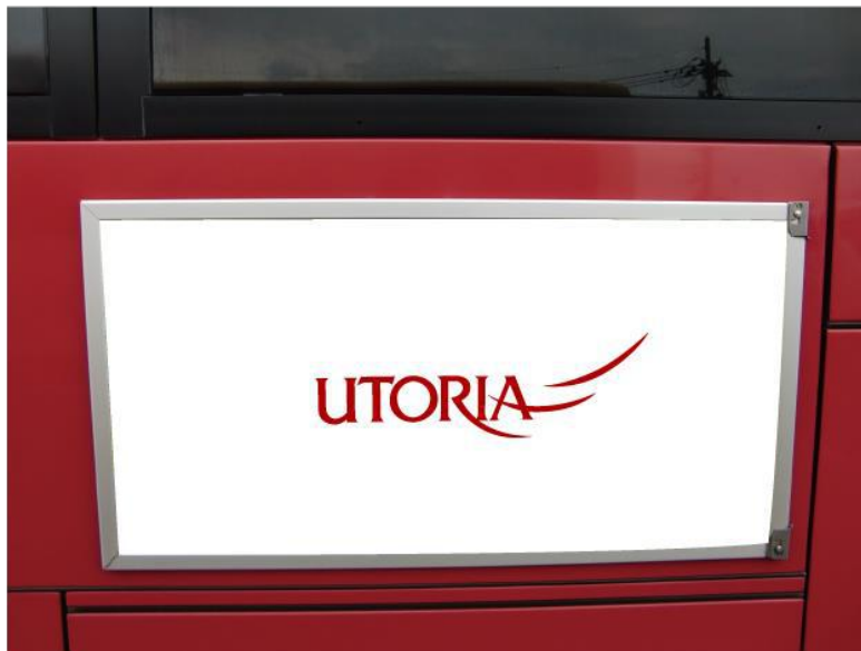
例：側面ショート板