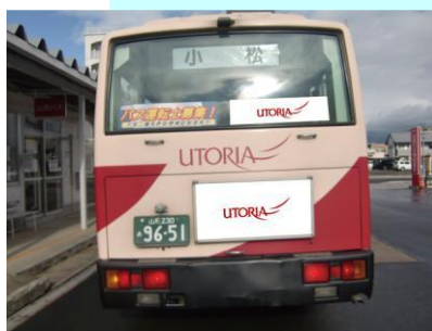
後部大板・後部ステッカー